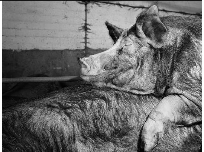
Unbedenklich, ja offenbar sogar Glück spendend: Sex zwischen Tieren

Die Befürworter von Strafverordnungen verweisen auf eine angebliche Szene von Menschen, die sich im Internet zum Sex mit Tieren verabrede. Es gehe nicht mehr um Einzeltäter wie früher,